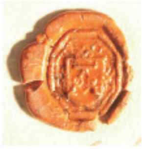
Afb. 3. Zegel Antonius Quast, 2 okt. 1662 Gelders Archief, Archief Leenkamer van Gelre en Zutphen, inv.nr. 144